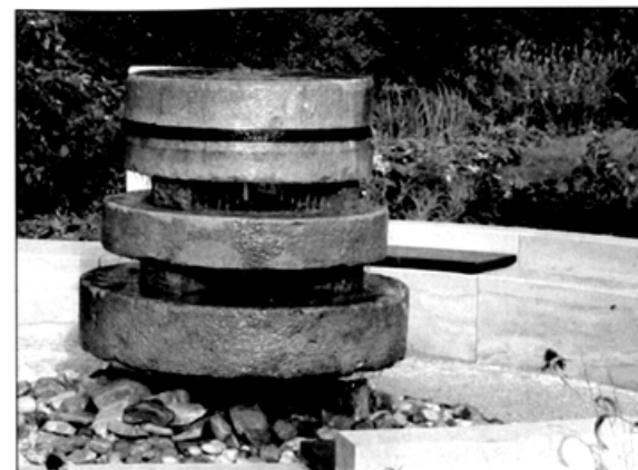
Mühlenbrunnen am Weißen Ross

„activ Verlag“ in Großenhain, enthält zahlreiche Abbildungen auch in Farbe sowie Tafeln/ Tabellen und kostet 14,50 Euro. Man bekommt es über den Verlag ( www.activ-verlag.de ) oder in der Buchhandlung Thalia, in der Buchhandlung